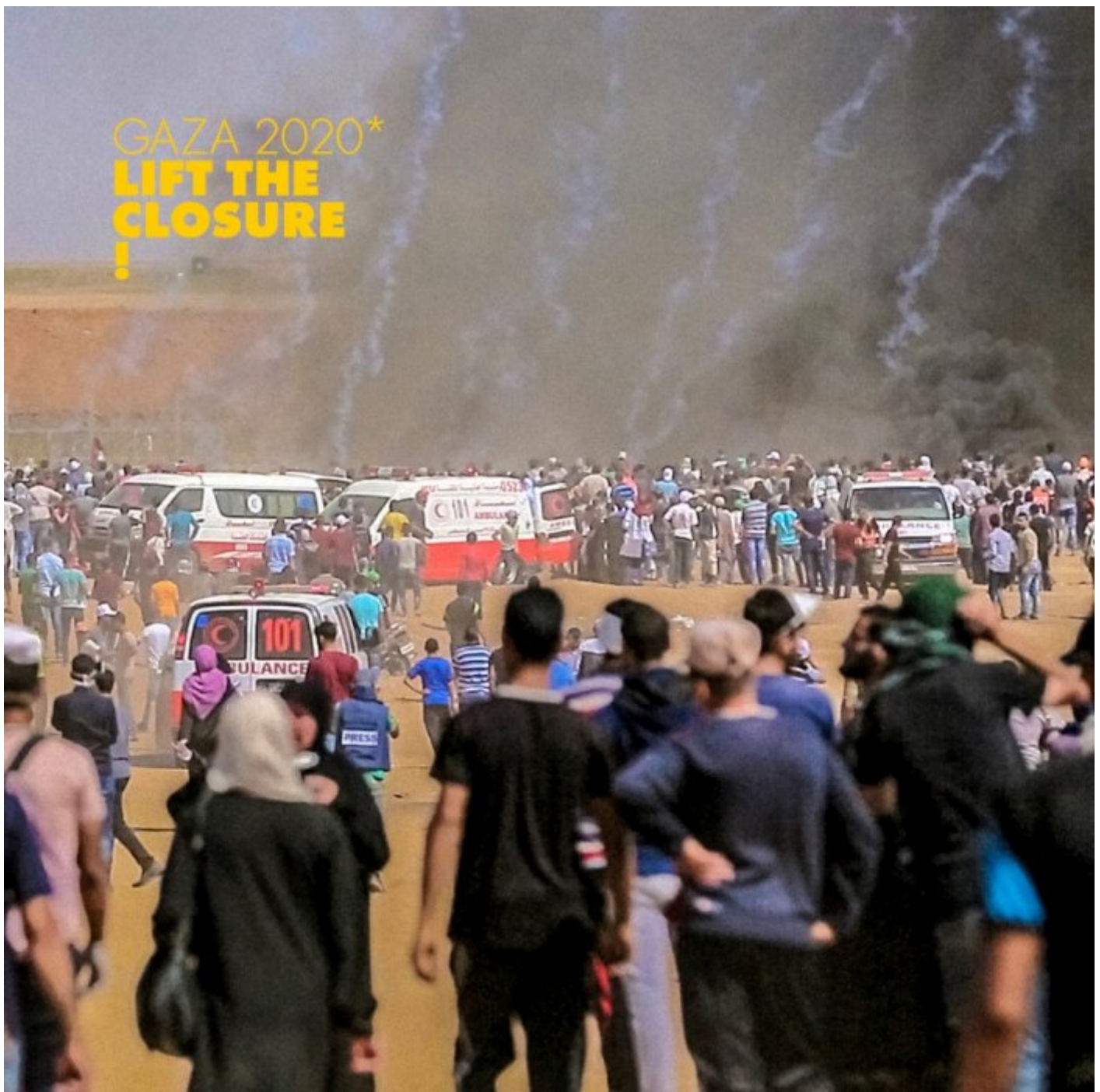
La Grande Marche du retour à Gaza

A partir du 30 mars 2018, lors de la Journée de la Terre, en réponse à des décennies d'oppression israélienne, les Palestiniens de la Bande de Gaza ont commencé à manifester sur une base quasi hebdomadaire près de la clôture périphérique de Gaza, appelant à la mise en oeuvre de leurs droits inaliénables, en particulier au droit au retour des réfugiés palestiniens et demandant que le blocus illégal de la Bande de Gaza par Israël soit enfin levé.