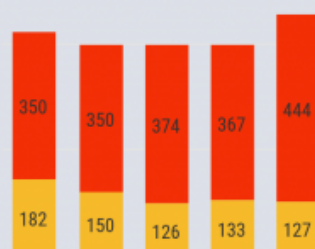
Mars Avril Mai Juin Juillet

Nombre moyen d'heures d'électricité par jour (2017)