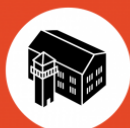
Evolution du nombre de Palestiniens en détention administrative