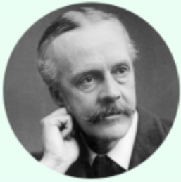
Lord Arthur Balfour Ministre des Affaires étrangères britannique