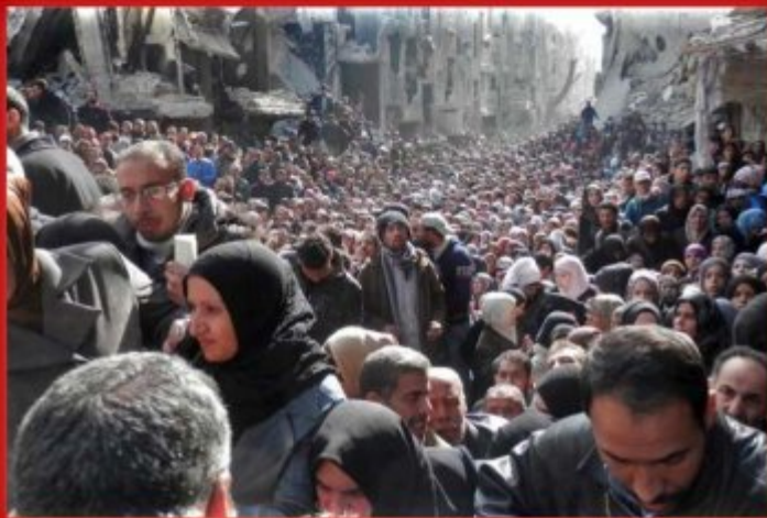
Syrie : Famine au camp palestinien de Yarmouk (Damas)

S'inscrire à partir de 20 € sur http://www.universite-si.org/