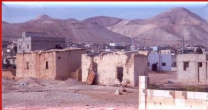
Palestine occupée : camp d'Aqabat Jabr (Cisjordanie)

L'histoire des réfugiés palestiniens est faite d'exils à répétition. L'absence de résolution de la question des réfugiés palestiniens a placé cette population dans une situation d' extrême précarité socio-économique et régulièrement de danger dans les pays d'accueil.