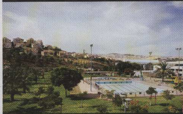
LA LUXURANCE DES INSTALLATIONS SPORTIVES DÉTONE EN CISJORDANIE